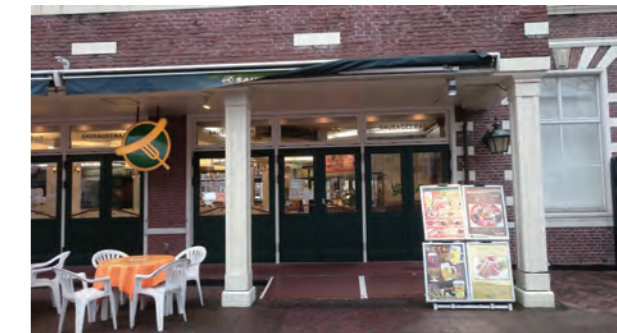
【ハウステンボス(2018年2月～)】