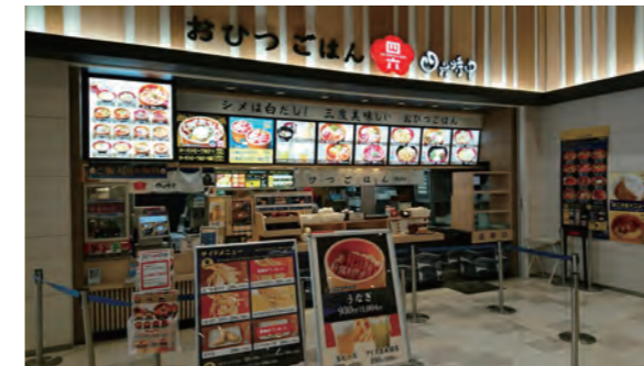
【イオンモール幕張新都心(2018年1月～)】